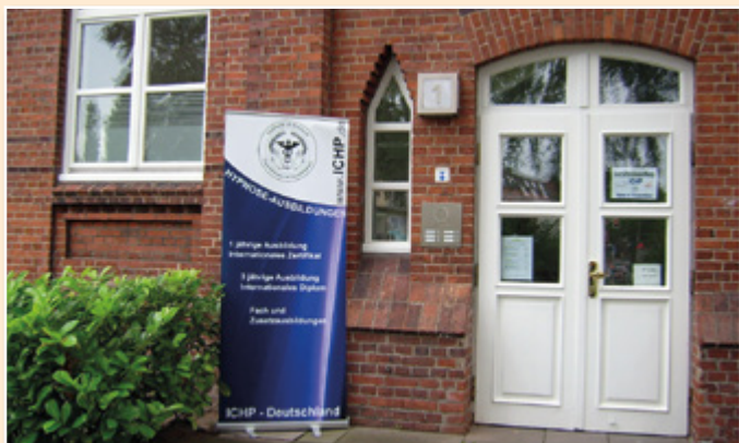
Praxis am Bramfelder Dorfplatz 1

Unter Hypnose versteht man einen natürlichen Bewusstseinszustand verstärkter Aufmerksamkeit und Erinnerbarkeit unbewusster Fähigkeiten und Ressourcen, die in der Hypnosetherapie nutzbar gemacht werden.