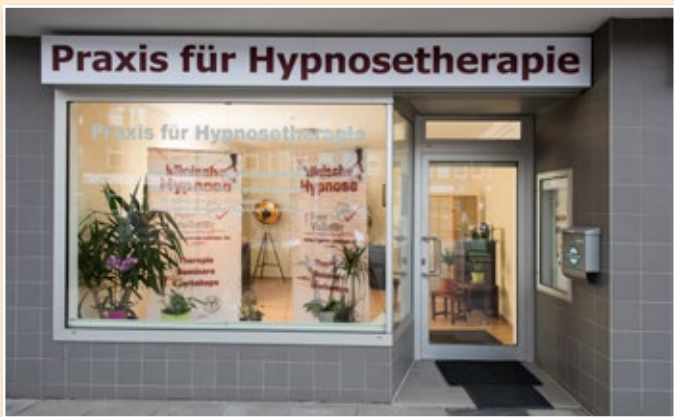
Praxis in der Bramfelder Chaussee 237